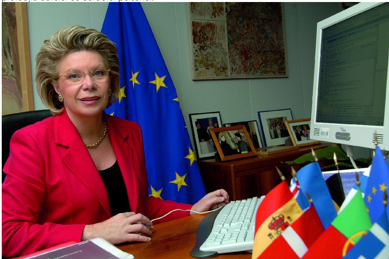
Viviane Reding, Comisar european pentru societatea informațională și media

Viața noastră privată se confruntă cu noi provocări: publicitatea comportamentală se poate folosi de istoricul căutărilor noastre pe internet pentru o mai bună promovare a produselor, site-urile de socializare accesate de 41,7 milioane de europeni permit difuzarea publică a datelor cu caracter personal, cum ar fi fotografiile, iar cu ajutorul celor 6 milioane de cipuri inteligente utilizate în momentul actual ni se poate urmări orice mișcare. Comisia Europeană a avertizat astăzi, cu ocazia Zilei protecției datelor, că normele cu privire la protecția datelor trebuie actualizate, astfel încât să se poată ține pasul cu progresele tehnologice și să se garanteze dreptul la respectarea vieții private, certitudinea juridică pentru industrie și adoptarea de noi tehnologii. Conform normelor UE, datele cu caracter personal nu pot fi utilizate decât în scopuri legitime și doar cu consimțământul prealabil al persoanei respective. Acum că Tratatul de la Lisabona și Carta drepturilor fundamentale au intrat în vigoare, Comisia a afirmat astăzi că dorește să elaboreze un cadru normativ clar și modern, aplicabil în întreaga Uniune Europeană, care să garanteze un înalt nivel de protecție a datelor cu caracter personal și a vieții private, începând cu reforma Directivei UE din 1995 privind protecția datelor cu caracter personal.