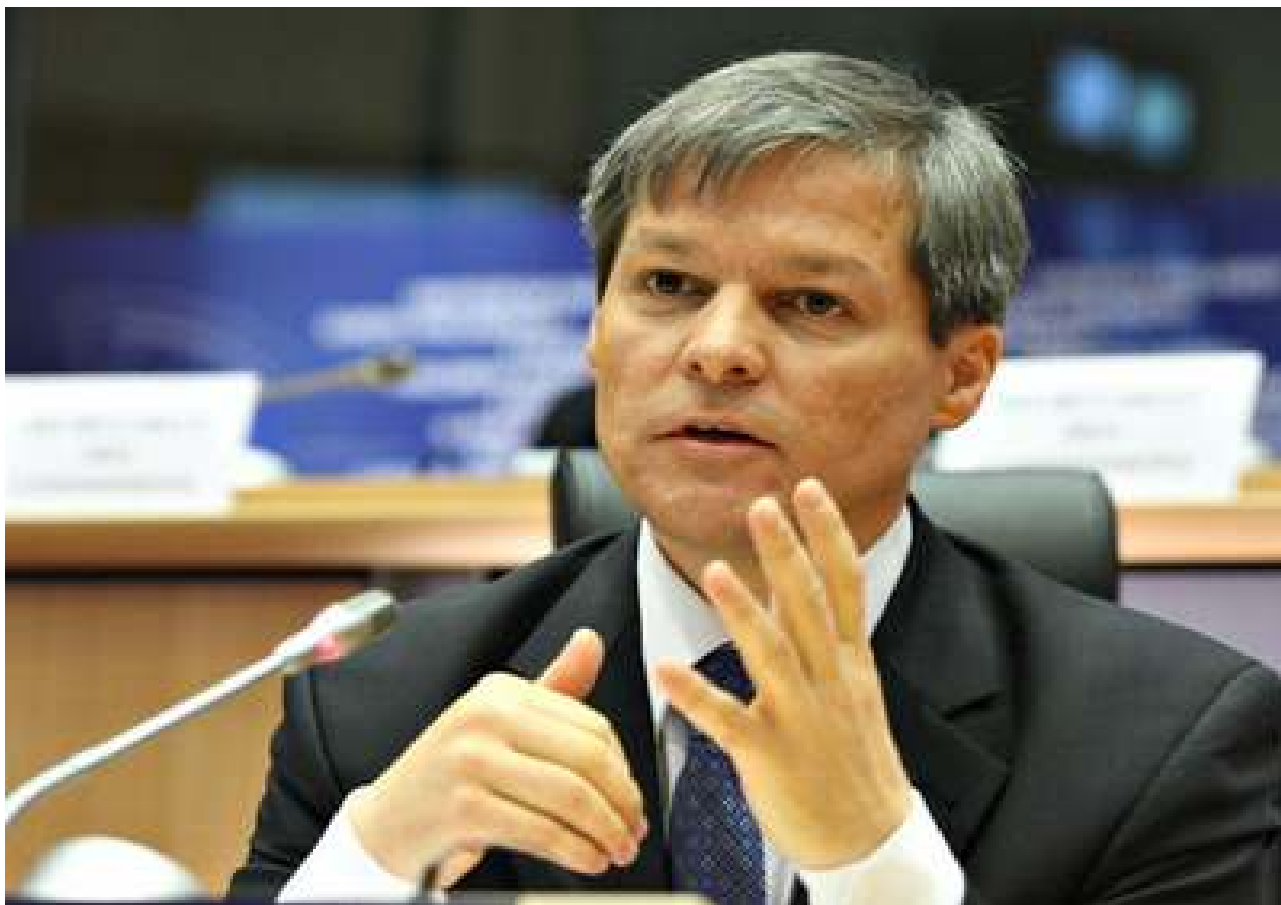
În imagine: Dacian CIOLOȘ , Comisar European pentru Agricultură

Este un moment bun pentru a sugera încă o dată cu tărie fermierilor din Romania să aibă mai multă încredere în formele asociative. Ele nu au nimic de a face cu regimuri trecute, ci după cum vedeți, cu necunoscutele capitalismului. Cadrul legal european dă mai multe posibilități de ajutorare a celor care încearcă să se ajute singuri în primul rând, asociindu-se, în acest caz, în organizații de producători.