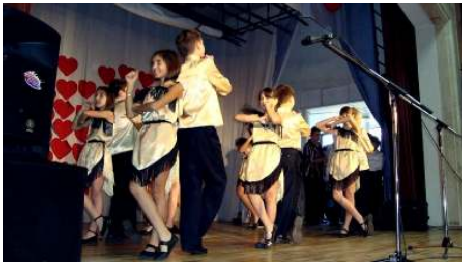
În imagine: Participanți la spectacolul dedicat muzicii și dansului balcanic la Pucioasa.

Politica de coeziune a UE a contribuit în mod semnificativ la creșterea economică și la prosperitate, conform unui raport publicat în luna noiembrie. Un material de Vlăduț Andreescu în pag. 13